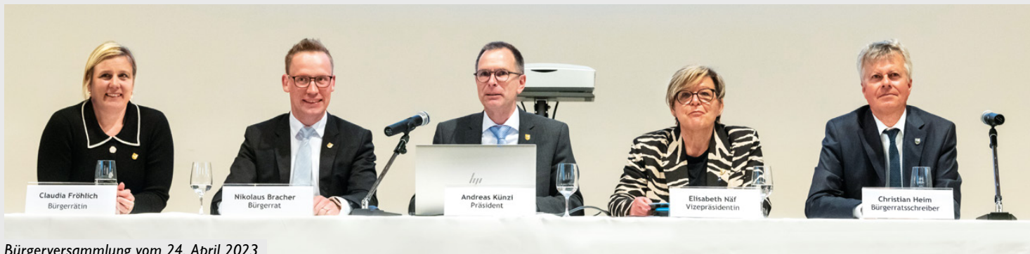
Bürgerversammlung vom 24. April 2023