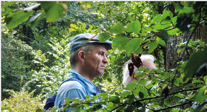
Hoher Besuch: Der angehende Bundesrat Beat Jans

Selbstverständlich durfte auch das Gesellige nicht fehlen. Bei der Scheune am Moosweg, unterhalb des Schiessstands, wurde die Gesellschaft mit einem erfrischenden Getränk und einer Wurst mit Brot und Senf verköstigt. Wer mochte, konnte noch eine Gasparini-Glacé als kühlendes Dessert genießen, war es doch ein äusserst warmer Nachmittag.